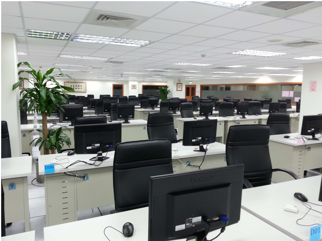
國家考試線上閱卷專屬場所