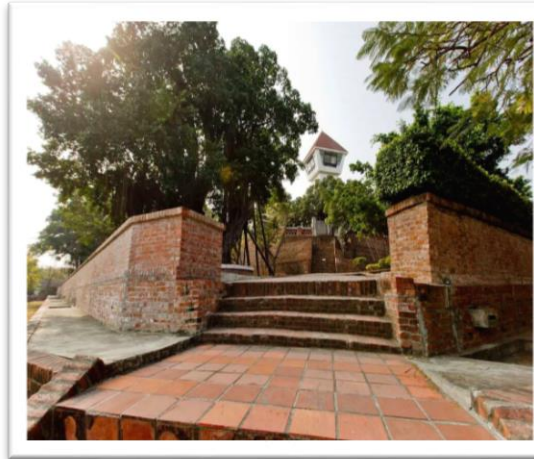
▲安平古堡