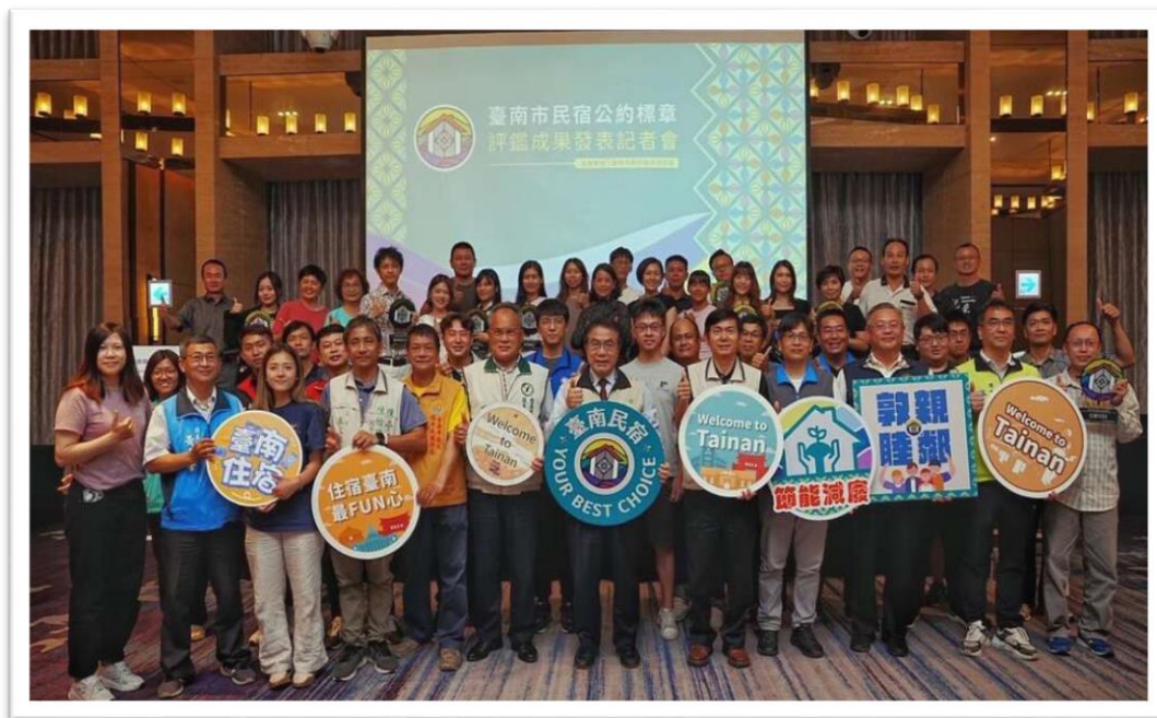
▲110 年度臺南市民宿經營公約認證成果發表會

為持續擦亮臺南民宿招牌，在辦理臺南專屬的民宿認證時，除民宿特色與硬體設施，特別著重民宿主人是否了解臺南人文歷史並且發揮主人熱情的待客精神，款待旅客，以提升民宿之品質。黃科長表示：在民宿業者申請項目中，有一項極為重要，即民宿業者需了解民宿周遭的觀光景點，另為提升民宿經營品質，會辦理輔導課程，邀請專家學者(如文化歷史學者)、各行各業者(如餐飲業)授課或分享，亦會有民宿達人現身說法，讓欲加入民宿業的人更了解民宿經營樣貌。