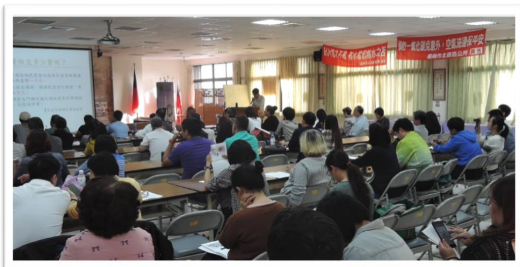
▲觀旅局舉辦都市型民宿公聽會與說明會

原有觀光旅館業者產生競爭感？黃科長為我們釋疑，依據民宿管理辦法規定，本市得設置民宿的區域除觀光地區、具人文或歷史風貌之相關區域外，尚有原縣區的非都市土地以及「偏遠地區」，臺南計有 23 個行政區向交通部申請指定為偏遠地區，可依法設置民宿，例如鹽水區、白河區等，另原臺南市 6 個行政區域，屬觀光地區或具有文化與歷史風貌地區，惟範圍較為狹小，未來觀旅局將視各區旅宿產業發展需求滾動檢討，讓有心經營民宿的業者得以合法設立登記。至於原有旅館業者是否反彈？黃科長表示，剛開始也會擔心，但綜觀整體觀光成效，111 年臺南市旅館與民宿的住宿率達 50%，相較過去平均住宿率僅有 30%，住宿率明顯提升不少，推測應是觀光旅館與民宿的客群不同，觀光旅館的客人多為經濟能力較高者，消費者為商務客或家庭旅遊，而民宿主要對象為年輕人或背包客，因此造就觀光旅館與民宿兩者相輔相成，形成 1+1 大於 2 的觀光旅遊宣傳效果，使臺南都市型民宿得以順利進行。