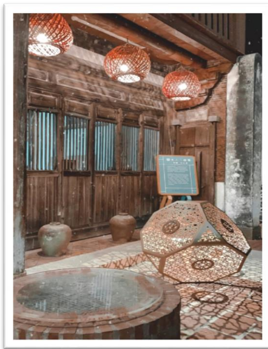
▲臺南鹽水區一隅