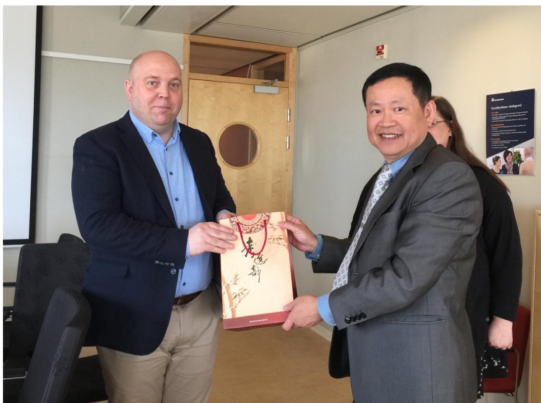
本部許政務次長致贈瑞典國家衛生及福利委員會代表紀念品