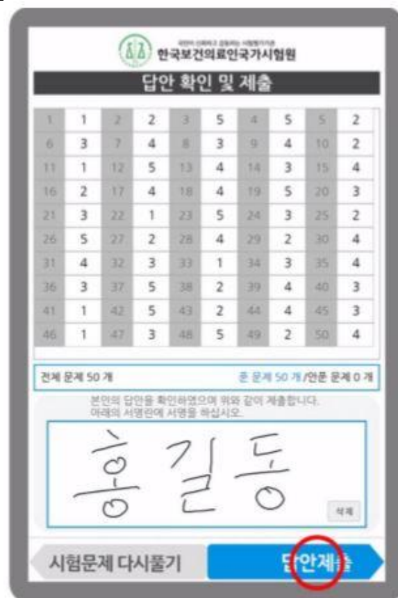
圖 6 應試系統作答結束畫面示意圖