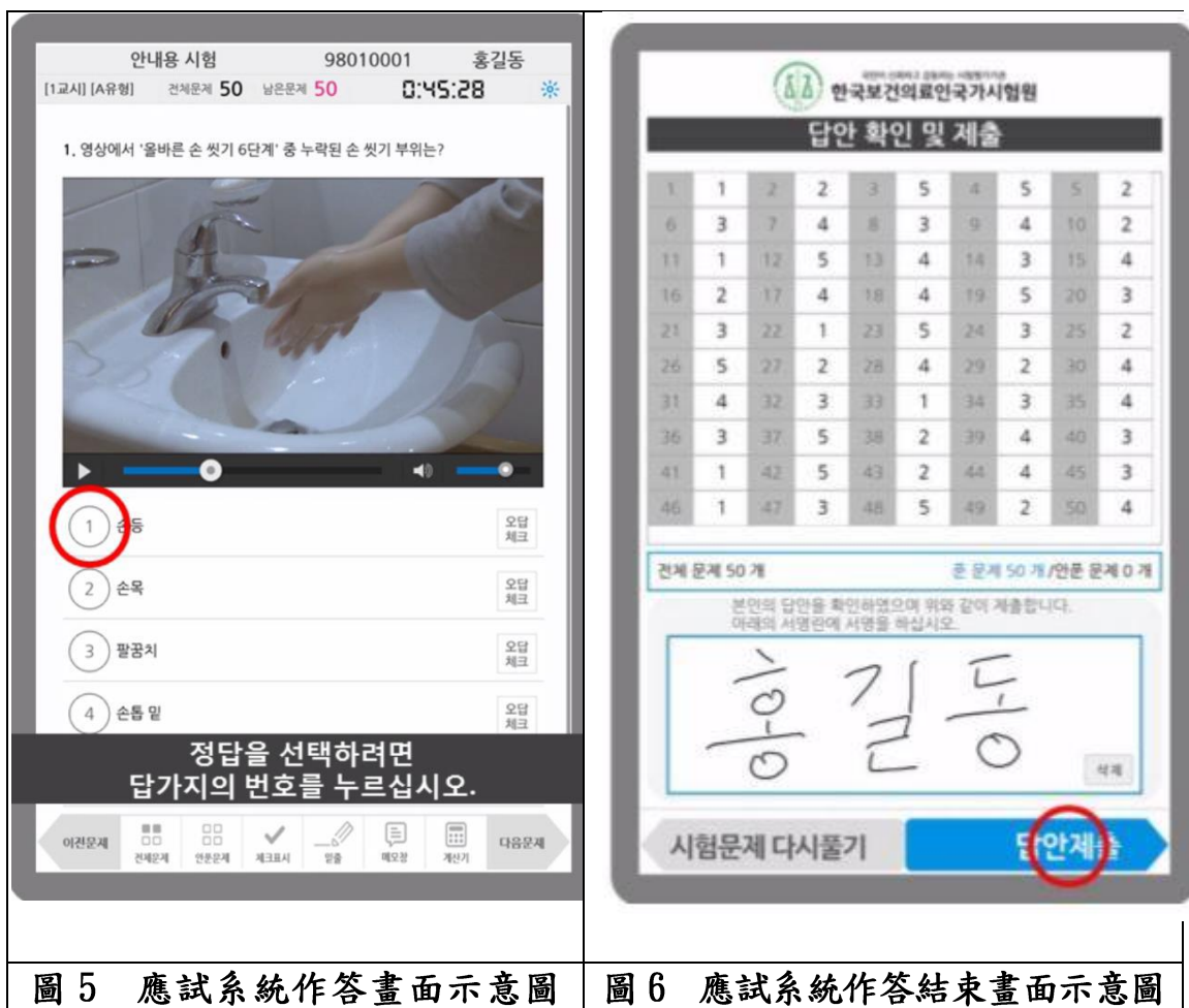
圖 5 應試系統作答畫面示意圖

應考人作答情形將定時儲存在應試工具及可攜式媒體 (SD Card) 中，應試中若應試工具故障或電力不足，監場人員將移出該設備的可攜式媒體，再安裝於備用應試工具中，並人工補足更換設備的處理時間。應考人作答係直接在平板電腦上作答 (詳圖 5)，應試時間由系統控制，應試畫面顯示考試時間，考試結束前 5 分鐘與 10 分鐘自動顯示提醒訊息；每節考試結束應考人尚未交卷前，系統會顯示應考人所有作答結果及已作答題數供應考人確認 (詳圖 6)，顯示畫面並自動被擷取儲存成圖檔，而作答結果則自動儲存在應試工具及可攜式媒體。