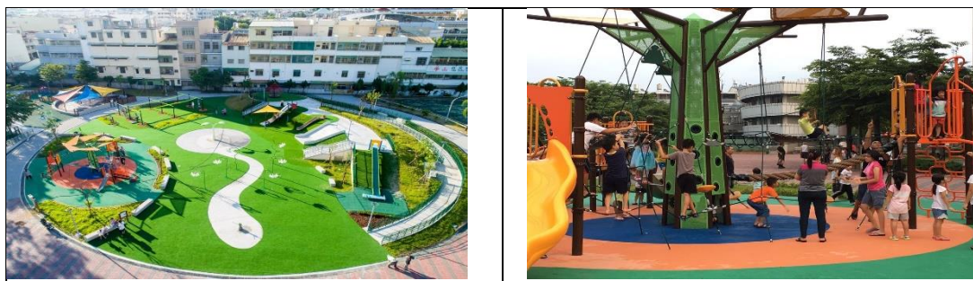
▲屏東和平公園共融遊戲場獲第八屆臺灣景觀大獎佳作

依修訂後的屏東縣公園管理自治條例，所建造的「和平公園共融遊戲場」，佔地 2500 坪，於建造完成時可說是南部最大的共融公園，尤其特別的是公園內的設施，是由兒童參與設計的，全區皆是無障礙設施，有全國首座無障礙滑軌、傑克樹屋、芽苗噴泉、花兒水霧、飛翔森林探險趣、無障礙滾輪滑梯等。