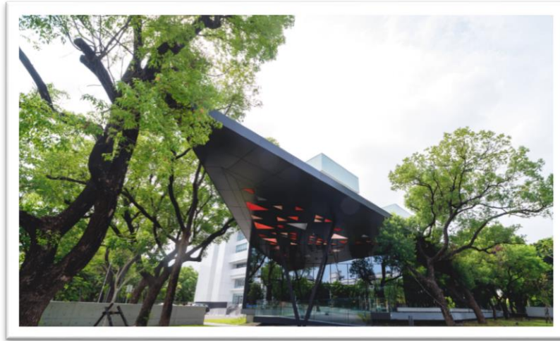
▲屏東縣立圖書館總館周圍都是 50 年的老樟樹林，被稱為森林中的圖書館

密度最高的獨立書店聚落，我們即透過與這些獨立書店合作，共同舉辦名人講座來推廣閱讀活動。開幕第一場講座由蔣勳老師主講，在屏東總圖的新大廳，伴隨著一整排 50 年老樟樹的搖曳樹影，與民眾分享生命的感動，是非常契合的。」直至現在，每年 9 到 11 月南國漫讀節仍會舉辦名人講座，並邀請大家回來看看屏東。