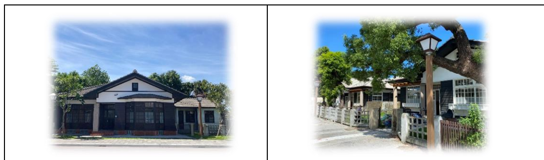
▲屏東勝利星村崇仁成功區 20 戶歷史建築公開徵選 (相片引用屏東縣政府 110 年 8 月 23 日最新消息相關相片)

勝利星村創意生活園區是全臺灣保存規模最大、數量最多、最完整的日式軍官宿舍建築群，107 年陸續修復完成的眷舍空間，它有何特殊眷村文化？又如何作為新式眷村體驗基地？李副處長為我們介紹道：「1920 年日本建置了全臺灣第一座飛行場，也就是屏東機場，由於空軍飛行員深受矚目，當時建設了大規模的高階軍官宿舍，其宿舍面積都有 300 坪以上，目前保留下來共計 106 棟的歷史建築，其特殊之處在於其為高階軍官、將領的宿舍，建築尺度大，有前庭、後院以及侍從官居住的側屋。」