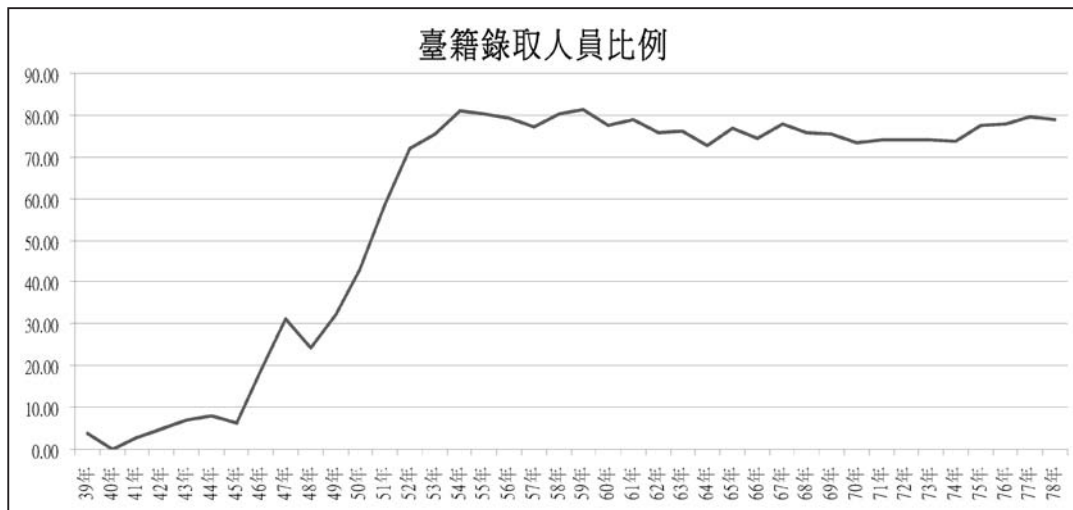
圖1 39年至78年全國性公務人員高等考試臺灣省籍錄取人員占全部錄取人員比例