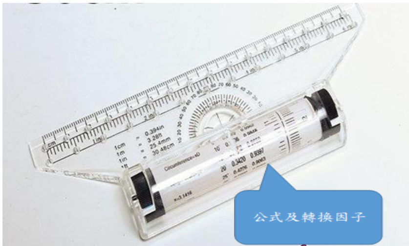
圖 2：多功能滾輪平行尺(具公式及轉換因子，不得使用)