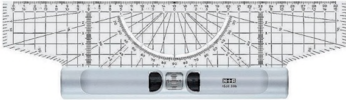
圖 1：簡易滾輪平行尺(可以使用)