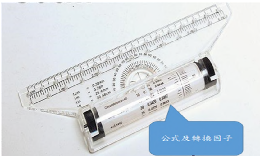
圖 2：多功能滾輪平行尺(具公式及轉換因子，不得使用)