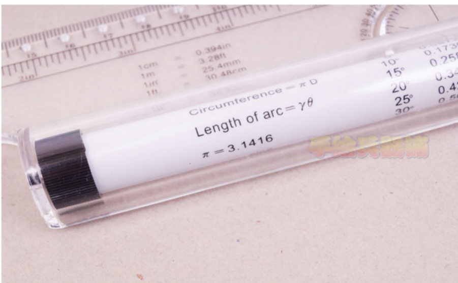
圖 5：多功能滾輪平行尺(具公式及轉換因子，不得使用)